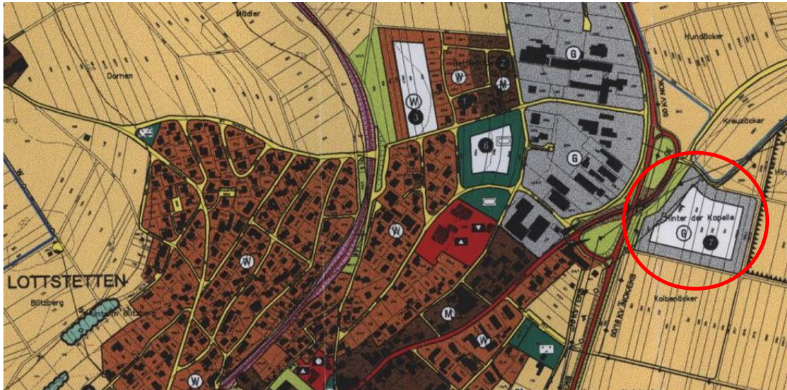
Auszug aus dem Flächennutzungsplan